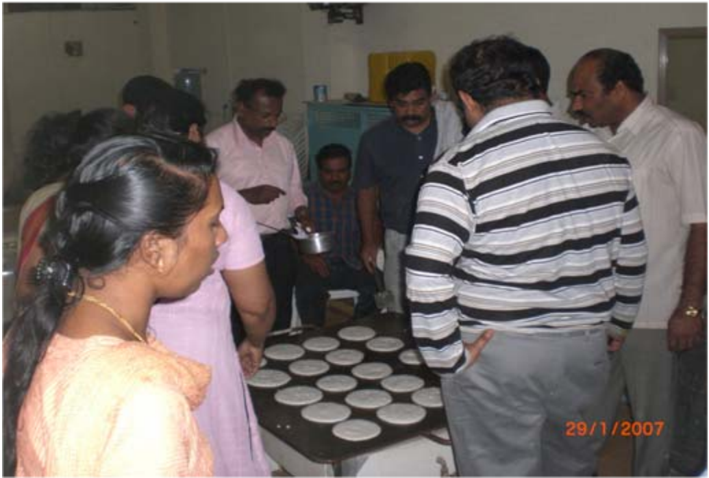
ഈ വർഷത്തെ മത്തനിക്കര ബാവായുടെ ഓർമ്മപെരുനാളിനോടനുബന്ധിച്ച് നേർച്ചയുണ്ടാക്കുന്ന ചില ദൃശ്യങ്ങൾ