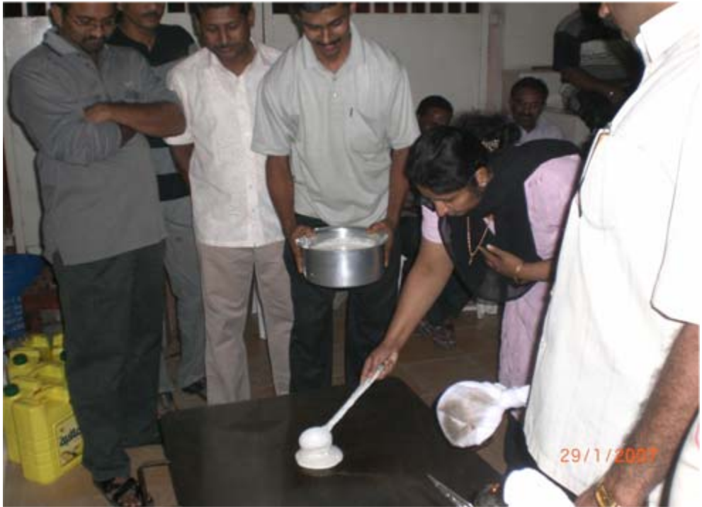
ഈ വർഷത്തെ മത്തനിക്കര ബാവായുടെ ഓർമ്മപെരുന്നാളിനോടുകൂടി നേർച്ചയുണ്ടാക്കുന്ന ചില ദൃശ്യങ്ങൾ