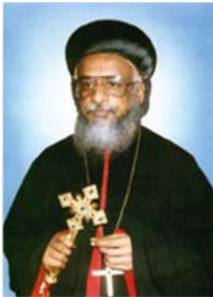
കുറിയാക്കോസ മോർ കുറിലോസ്, അടൂർ മാർച്ച് 21