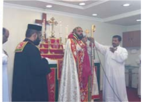
Holy Qurbana on 40 th Friday