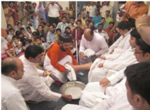
കാൽ കഴുകൽ ശുശ്രൂഷ