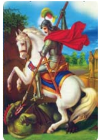
Diyo & Diya