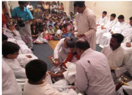
കാൽ കഴുകൽ ശുശ്രൂഷ