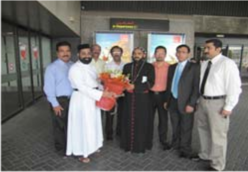
Reception to H.G @ Airport