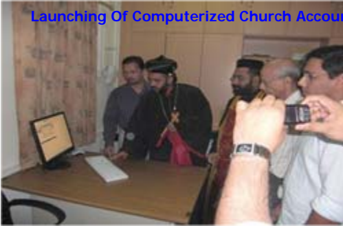
Launching Of Computerized Church Accounting System By H.G Mathews Mor Aphrem