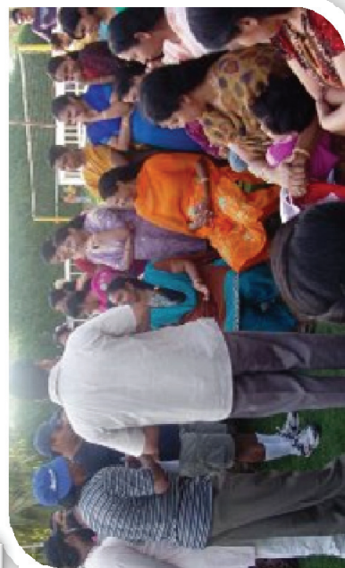
Annual picnic 2009 scenes