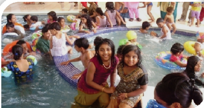
Annual picnic 2009 scenes