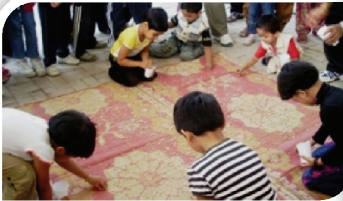
Annual picnic 2009 scenes