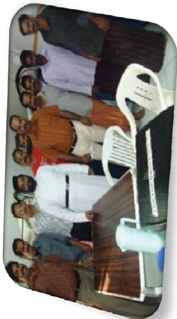
Area Unit House Visiting Scenes