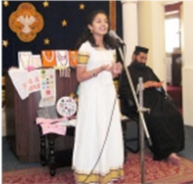
Summer class finale