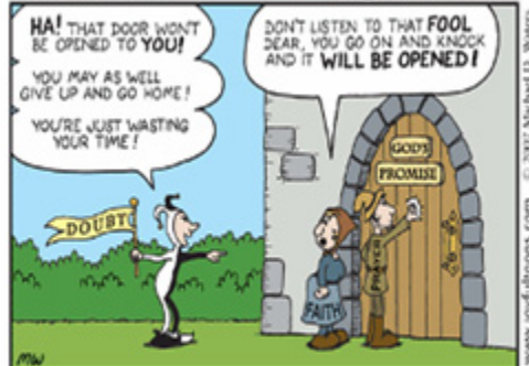
KNOCK KNOCK A Joyful Toon by Mike Waters

Ask and it will be given to you; seek and you will find; knock and the door will be opened to you.