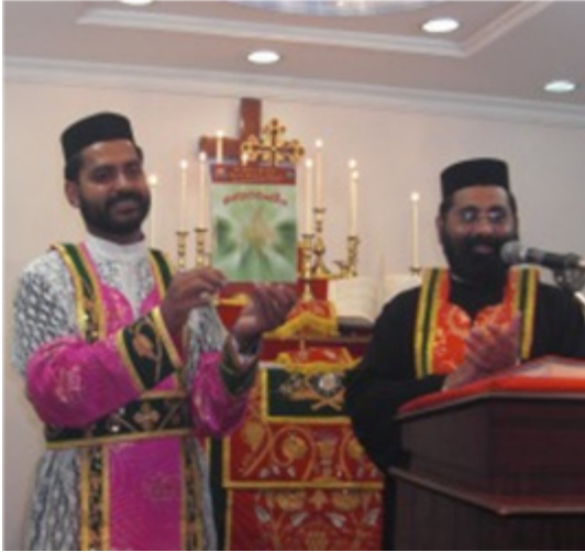
എട്ടു നോമ്പു പെരുനാളും സുവിശേഷ യോഗവും വിവധ ദൃശ്യങ്ങൾ