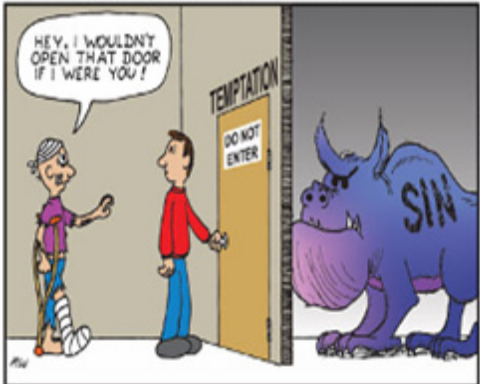
DON'T OPEN THAT DOOR A Joyful Toon by Mike Waters

If you do what is right, will you not be accepted? But if you do not do what is right, sin is crouching at your door; it desires to have you, but you must rule over it. - Genesis 4:6-7 ntc