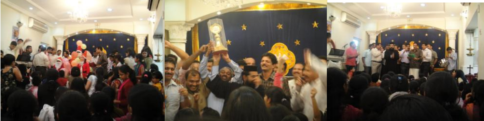
New Year Programme at our Church Adult Competition Ever Rolling Trophy