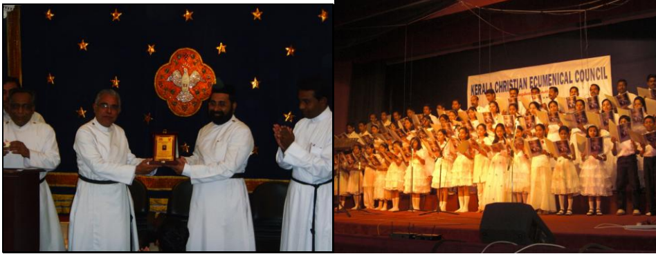
Sent off to our Vicar by KCCEC

Celebrated the Christmas and New Year on the first day of January 2010 after the Holy Qurbana at the Church. All childrens are presented with Gifts for the New Year. Santa Clause visited during the celebrations and gave sweets to all. All enjoyed well.