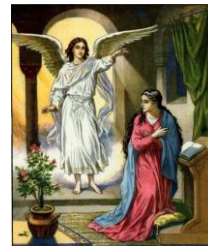
The Angel Gabriel Appears to Mary Mary, the Mother of Jesus

Mary was a Jewish girl who lived in the city of Nazareth. She was engaged named Joseph. Mary didn't know it yet, but God had chosen her from among to be married to a man all the Jewish maidens to fulfill a very special purpose for Him. God sent an angel to her with the message. The angel Gabriel said to her, "Greetings, O favored one, the Lord is with you!" Mary was afraid, but the angel explained to her that she was going to have a son, and his name was to be Jesus. Mary's baby was