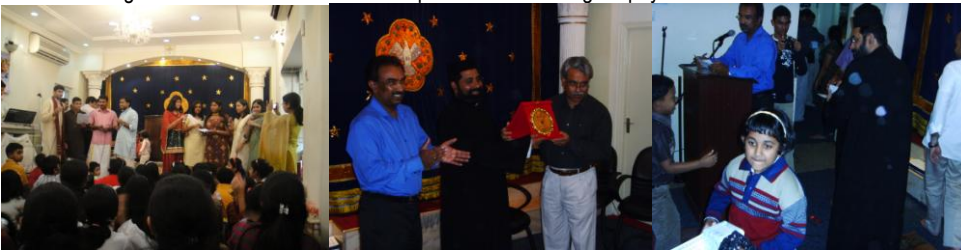
Christmas Carol Song