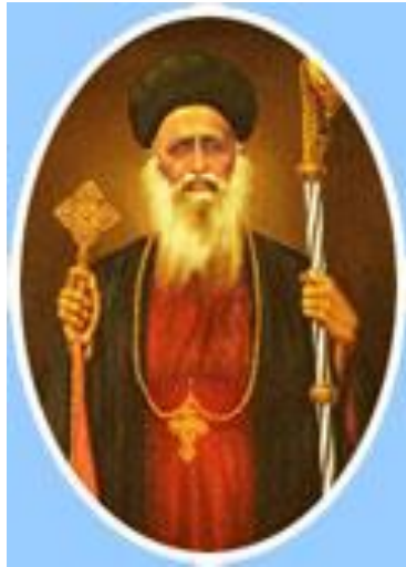
Inserted by MRS. LEENA BENNY