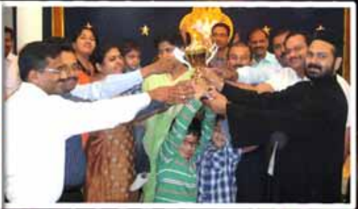
2nd Price ( Tabor & Bethani )