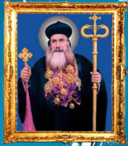
Prince & Family