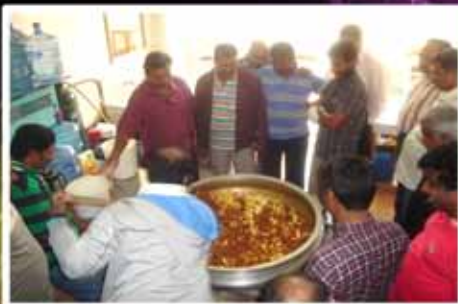
Paulose Mor Athanasios