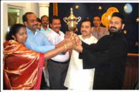
1st Price ( Bethel )