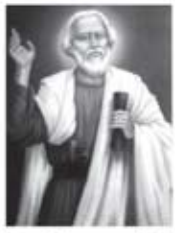
Our Patron Saint ST. PETER

Our Patriarch His Holiness Moron Mor Ignatius Zakka I Iwas