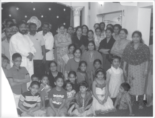
Church cleaning by Youth Association