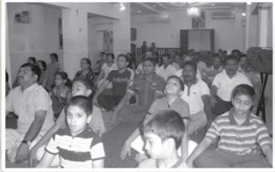
സോഷ്യൽ സർവ്വീസ് ലീഗ് നടത്തിയ യോഗ ക്ലാസ്സിൽ നിന്ന്