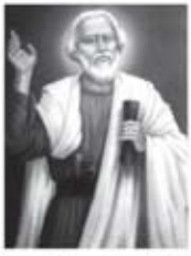
Our Patron Saint ST. PETER

Our Patriarch His Holiness Moron Mor Ignatius Zakka I Iwas