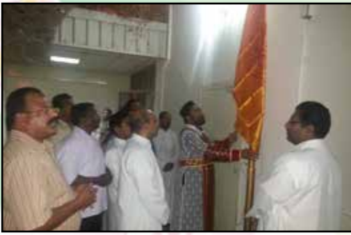
Antiocha Simhasana Sthapaka Dinam