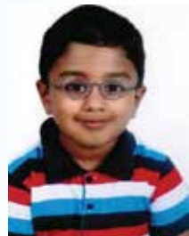
Art by Deo Saji