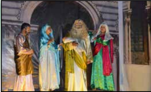
KCEC Procession Tablo