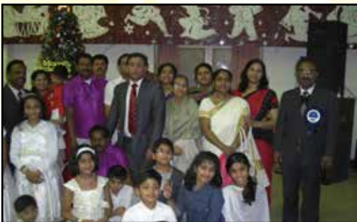
KCEC Xmas Tree 2nd Prize