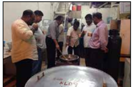
St. Poulose Mor Athanasious Thirumeni - Nercha Preparation & Blessings