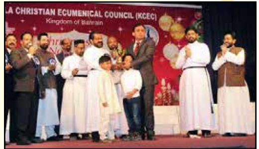
KCEC Procession 3rd Prize