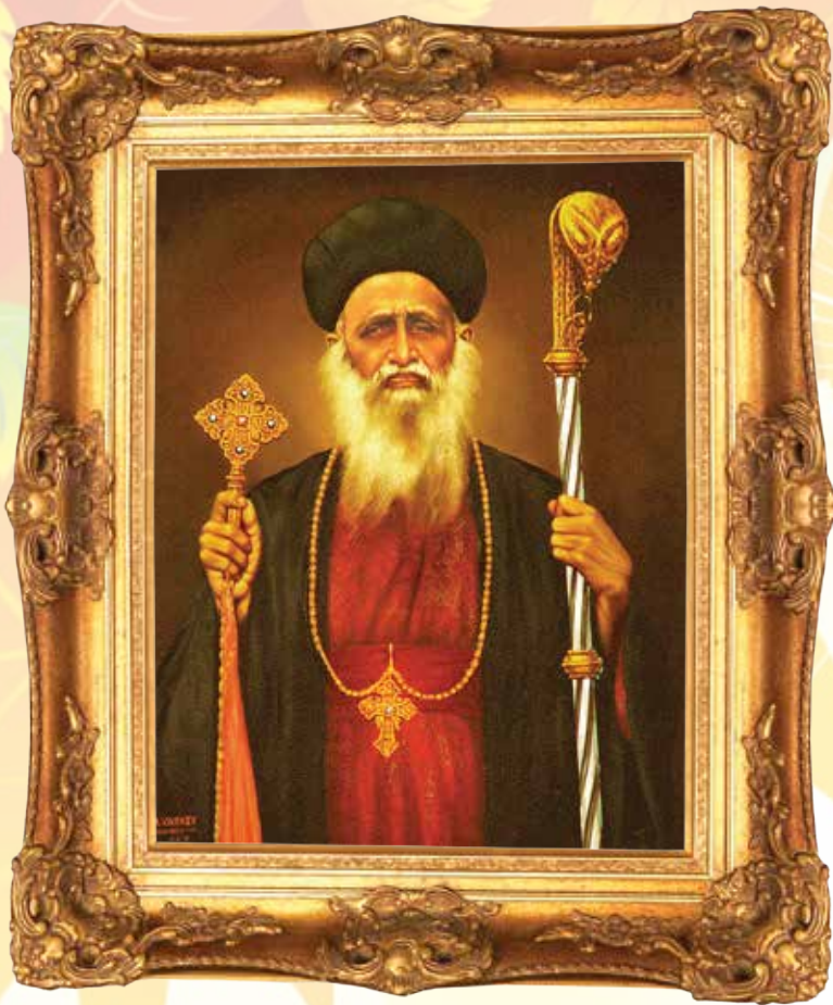
പൗലോസ് മാർ അത്താനാസിയോസ് വലിയ തിരുമേനി (ആലുവ 1935)