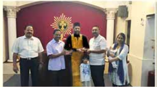
Appreciation Award for 2 nd Highest Ticket Selling