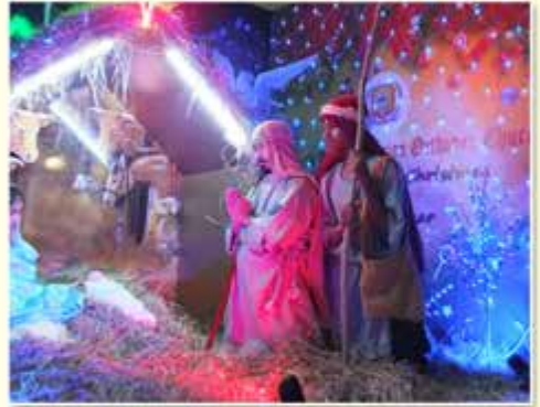
Tableau - KCEC Rally