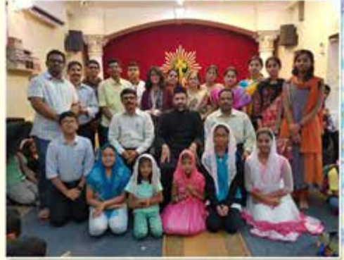
Proud of St. Peter's - KCEC Winners