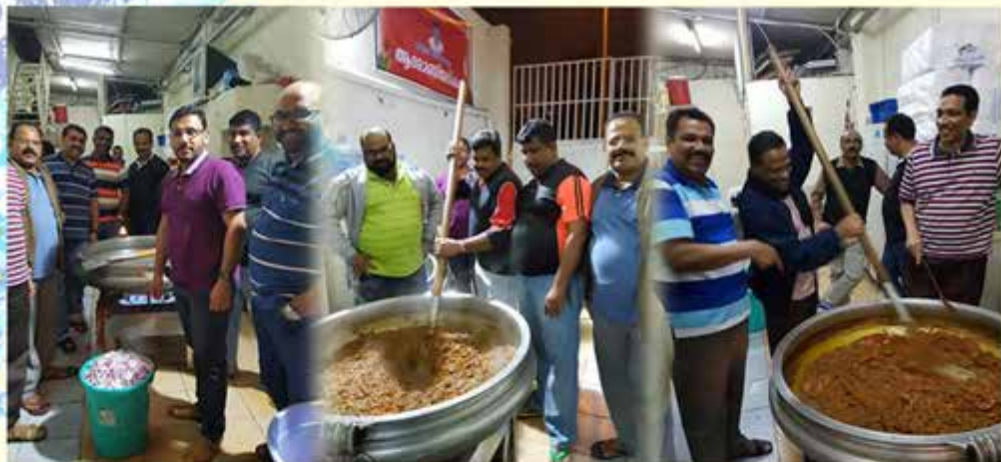
Perunnal Nercha Preparation - St.Athanasios Paulose (Aluva)