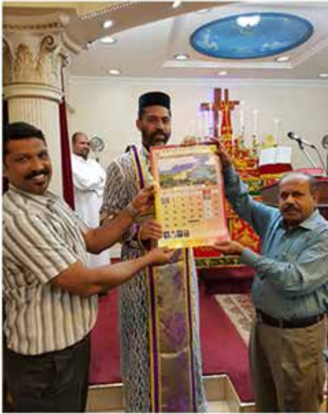
Calendar Releasing 2017