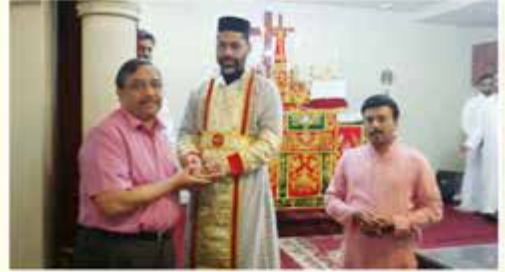
Nuhro 2016 - Raffle draw 1 st Prize Winner