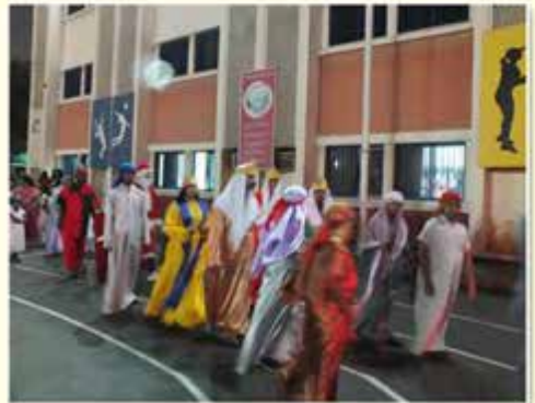
Moments - KCEC Rally