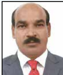
Mathew P.T 39608961

Manama, Inside Manama Sh. Hamad Road (Left)