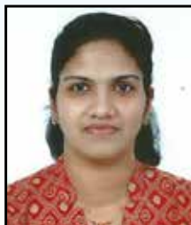
Molly Baby 39097853