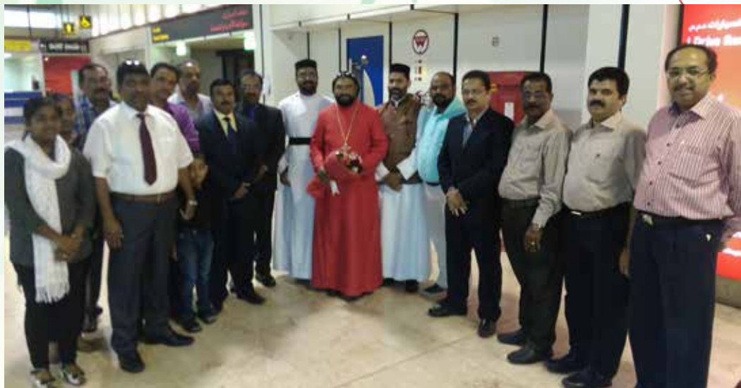
HG Paulose Mor Ireneus Metropolitan visit