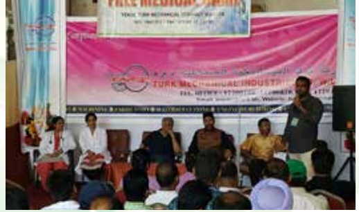
Medical camp conducted by Youth Association