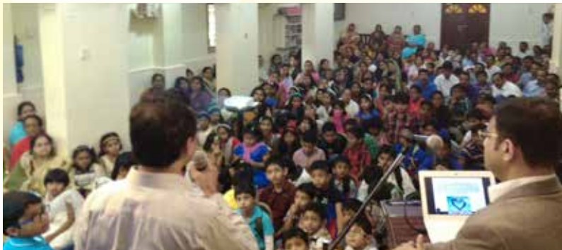
Cardiac Awareness programme