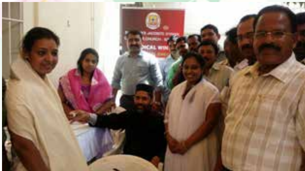
Health checkup by Medical Wing