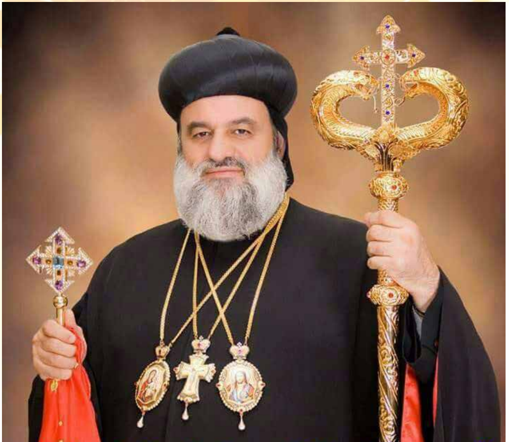
അൻപത്തിരണ്ടാം ജന്മദിനം ആഘോഷിക്കുന്ന പരിശുദ്ധ മോറാൻ ആശംസകൾ