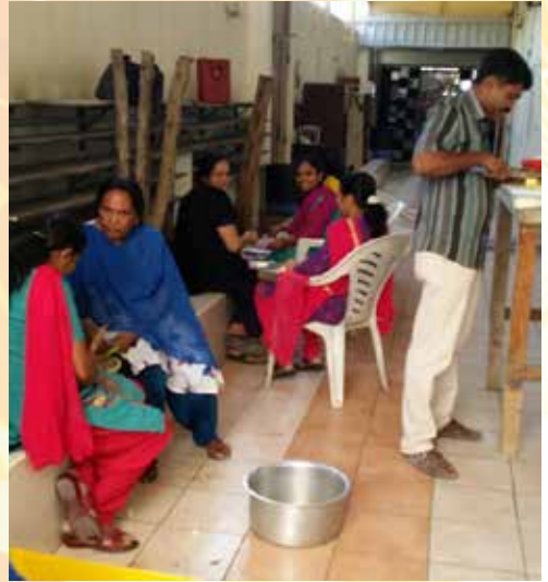
Paravur Bawa nercha preparation