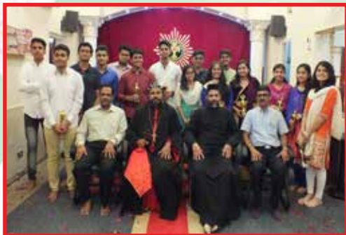
Trophy for 10th & 12th Board exam students