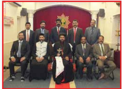
2017 MC with Thirumeni