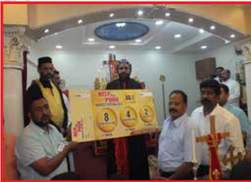
Releasing Harvest Festival Raffle ticket