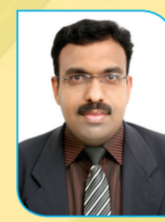
Bajju PM Mob: 39047793