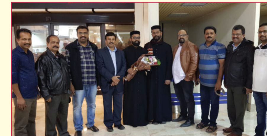
Monthly news letter - February 2020