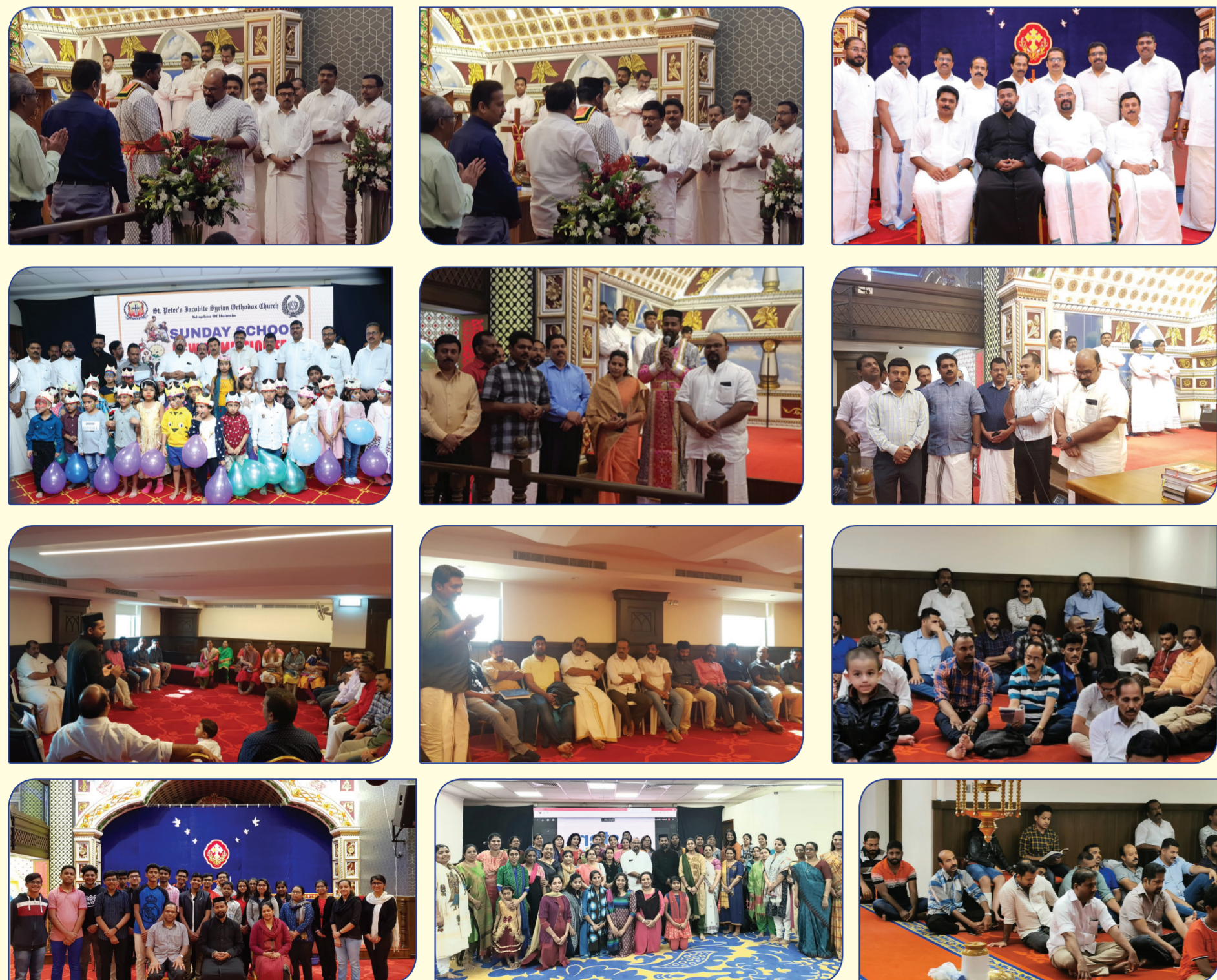
Monthly news letter - February 2020